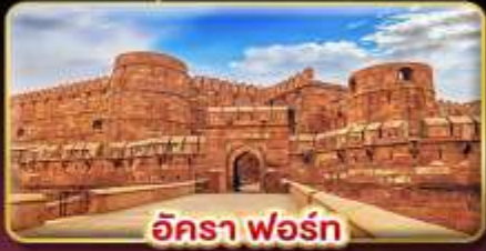
อัครา ฟอรั