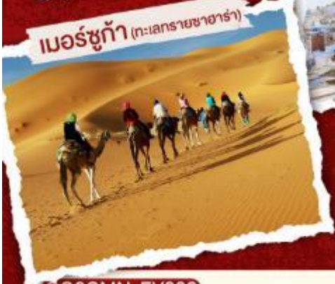
เมอร์ซูท้า (ทะเลทรายซาฮารา)