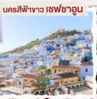
นครสีฟ้าชาว เซฟชาอูน