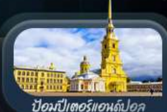
ป้อมปีเตอร์แอนด์ปอล

highlight สองเมืองไฮไลท์ของรัสเซียที่ไม่ควรพลาด! ตื่นตาตื่นใจกับมหาวิหารเซนต์บาซิล ชมความยิ่งใหญ่ของจัตุรัสแดง สัมผัสอดีตที่พระราชวังเครมลิน ชมความงามของสถานีรถไฟใต้ดิน มอสโก ชาร์กอร์ส โบสถ์ไอสิกริบดี เป็นเขาสเปร์โรว์ให้คุณได้สัมผัส ชมความงามพระราชวังฤดูหนาว พิพิธภัณฑ์เฮอร์มิเทจ ป้อมปีเตอร์แอนด์ปอล และมหาวิหารเซนต์ไอแซค