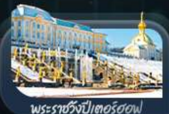
พระราชวังปีเตอร์ฮอฟ