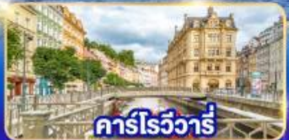
คาร์โรวัวร์