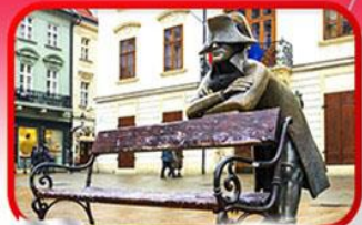
ย่านเมืองเก่าปราทิสลาวา

เที่ยวเมืองสวยริมทะเลสาบ ฮัลล์สตัดท์ • ชมเมืองไข่มุกแห่งโบฮีเมีย เซสกี กรุงลอน • ปราท • เวียนนา • ซอปปิงพาร์นดอร์ฟ เอาก์เล็ท