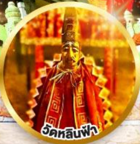
วัดลีนฟ้า ขอพรเสริมโชคกลางในธุรกิจ และการเงิน