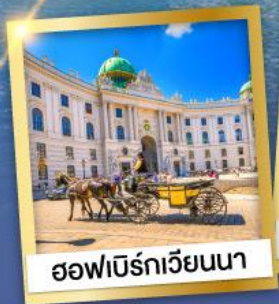
ออฟเบิร์ทเวียนนา