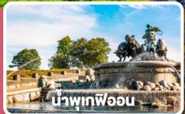
น้ำพุเทพี

พิเศษ พักค้างคืนเรือสำราญ DFDS พร้อมมื้ออาหาร Scandinavian Buffet