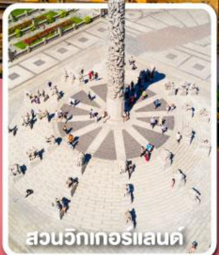
สวนวิกเตอร์แลนด์