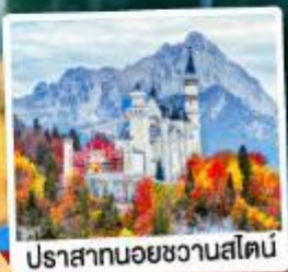
ปราสาทน้อยชวานส์ไตน์

เดินทาง 7วัน 4คืน 02-08 พ.ค.69 24-30 มิ.ย.69 02-08, 16-22 ก.ย.69