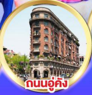
ถนนอู่คัง