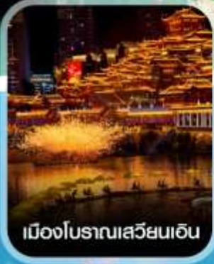
เมืองโบราณเสวียนเอ็น