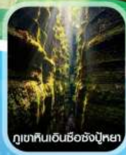
ภูเขาหินเอ็นชือชิงปู้หยา