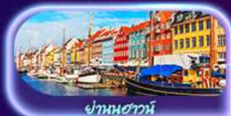
ย่านนูฮาวน์

เยือนคาบสมุทรสแกนดิเนเวีย ดินแดนแห่งยุโรปเหนือ ชมความงามสโตนอร์ติกสุดมหัศจรรย์ สถาปัตยกรรม โบสถ์กัมเพลยวดีโอ อาสนวิหารอูสเพนสกี อนุสาวรีย์ซิมลิวส์ พิกัดห้ามพลาดจัตุรัสวุฒิสภาเฮลซิงกิ เยี่ยมชมพิพิธภัณฑ์ทว่าซา ศาลาว่าการสตอกโฮล์ม ย่านเมืองเก่า Gamla Stan ถ่ายภาพ Oslo Opera House สวนมนุษย์ชาติ Vigeland ป้อมปราการอาครัสฮูส มหาวิหารออสโล เข็มจีนแลนด์มาร์คน้ำพุเทพีออน รูปปั้นนางเงือก พระราชวังมาเลียบนอร์ก พระราชวังคริสเตียนบอร์ก ย่านคิงส์ย่านนูฮาวน์ ซ้อมเบียร์เฮลซิงกิ ถนนคนเดิน Strøget