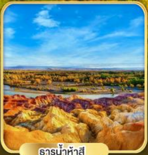
ธารน้ำห้ำส