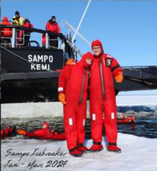
Sampo Icebreaker Jan - Mar 2027