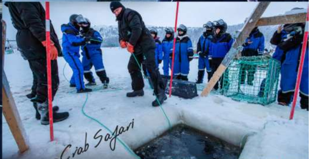
King Crab Safari