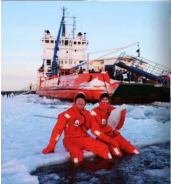
Polar Icebreaker Apr 2027