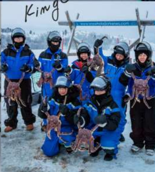
King Crab Safari