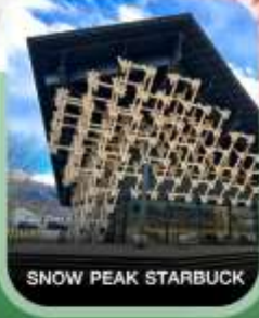
SNOW PEAK STARBUCK