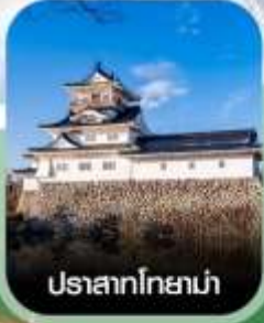
ปราสาทโทยาม่า

คอนเฟิร์มออกเดินทาง ทุกพีเรียด 2ท่านขึ้นไป