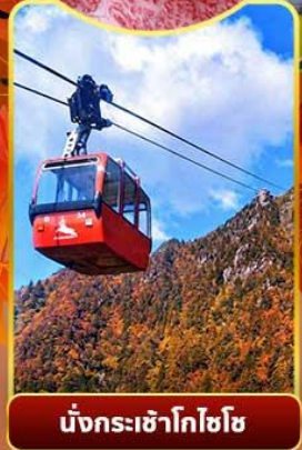
นั่งกระเช้าโกโซโซ