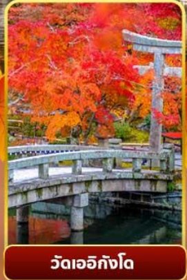
วัดเอทังโง