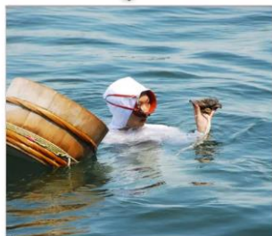
เกาะมิกิโมโตะ (ไซวอามะ)