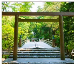
ศาลเจ้าอิเสะ