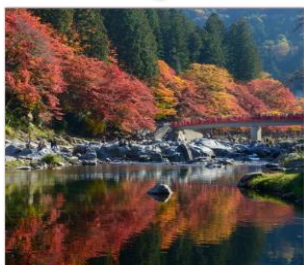
หุบเขาโครันเด