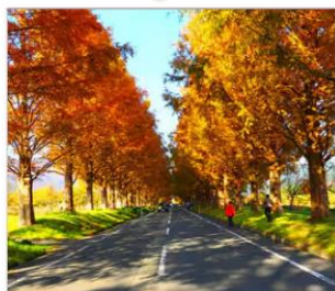
ทิวสนเมตาเซดวอยานามิกิ