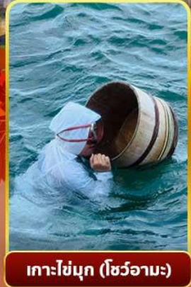
เกาะไข่มุก (โซวามะ)