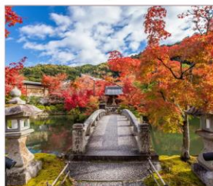
วัดเจอิกันโด