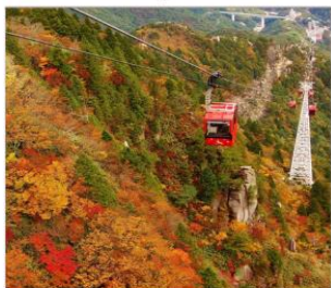
นั่งกระเช้าโกไซโซ