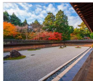
วัดเรียวอันจิ

THAI สายการบินไทย บริการทุกระดับประทับใจ FULL SERVICE