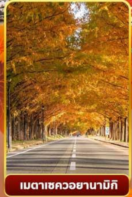
เมตาเซควอยานามิกิ

ออนเซ็น 3 คั้น นน.กระเป๋า 1 ใบ 23 กก. 7Days 5Night