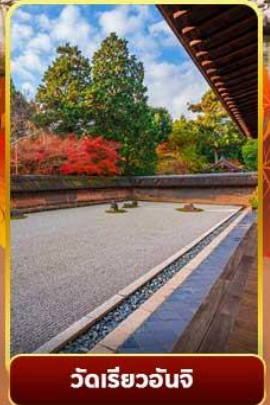
วัดเรียวอันจิ