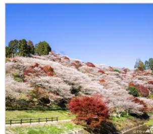
โอบาระ(ซึกิซากุระ)