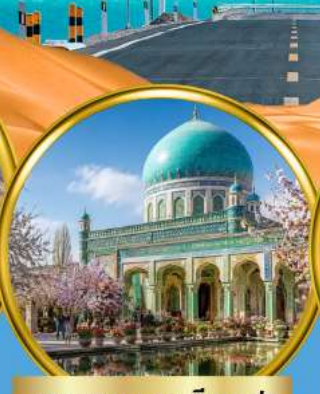
สุสานสมหอมเซียนเฟย