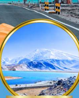
Kala Kule Lake