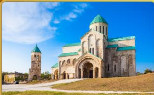
มหาวิหารขากราติ