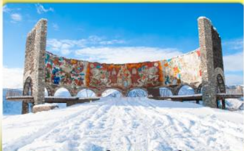
อนุสรณ์สถานรัสเซีย