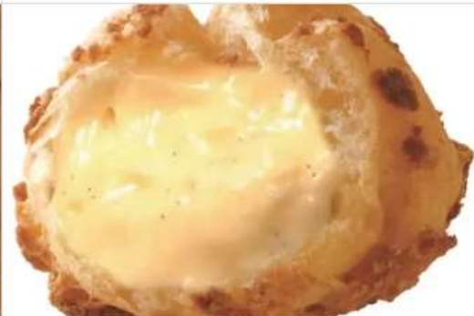
Gourmet Beard Papa 1F[1029]