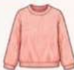
เสื้อสเวตเตอร์ถัก หรือคาร์ดิแกน