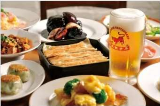
Gourmet BENITORA GYOZABOU 狐虎餃子屋 1F[1092]

นำท่านเดินทางสู่ AEON TOWN SHOPPING MALL ท่านสามารถอิสระซื้อสินค้าทั่วไปของญี่ปุ่นเช่น ขนม, อาหารว่าง, ของเล่น, กระเป๋า, รองเท้า, เสื้อผ้า