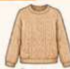
เสื้อไหมพรม