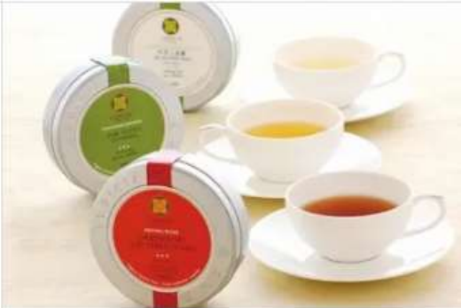
Gourmet LUPICIA LUPICIA 1F[1026]