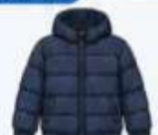
เสื้อขนเป็ด