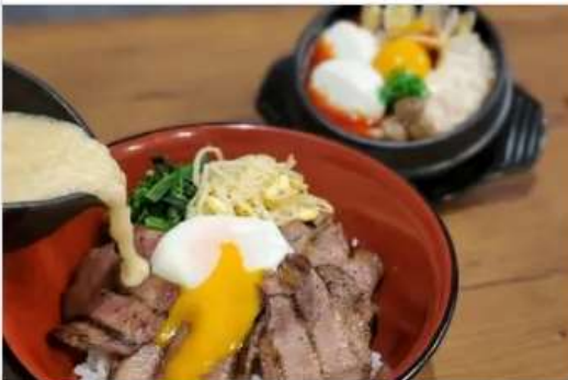
Gourmet MUGITORO & HAN 1F[1081]