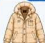
เสื้อโค้ทกันหนาว ตัวหนา