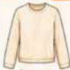
เสื้อแขนยาว