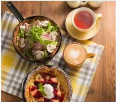
Gourmet Grace Garden Nature Grace Garden 1F[1095]