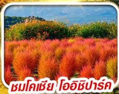
ชมโคเชีย โออิชิปาร์ค