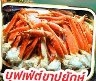
บุฟเฟ่ต์ซาปูยักษ์