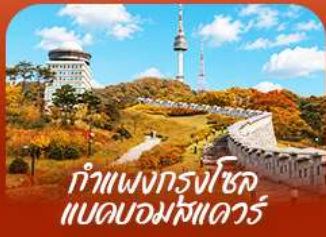
ทำแพนกรงโซล แบบบอมบ์แควร์

ออกเดินทางสู่ร่องราวแห่งฤดูใบไม้เปลี่ยนสี สัมผัสความงดงามของเกาะบาบิและอุทยานแห่งชาติชอรัคซาน เพลิดเพลินกับความสนุกเต็มอิ่มที่สวนสนุกเอเวอร์แลนด์ • เก็บภาพความประทับใจท่ามกลางทุ่งหญ้าสีทอง และใบไม้หลากสีที่สวนฮานิลปาร์ก • พร้อมชมวิวหอคอนันซานจากแบบคอนสแควร์ • เต็มเต็มความสุข ด้วยการลิ้มลองสตรีทฟู้ดรสเลิศที่ตลาดบึงวอน • ก่อนเพลิดเพลินกับการช้อปปิ้งในกรุงโซลตลอดทริป