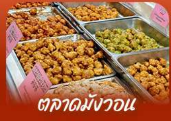
ตลาดม้งวอน