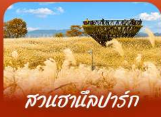
สวนฮานิลปาร์ก