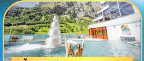
แช่น้ำแร่ร้อนผ่อนคลายลวยคอร์บิค