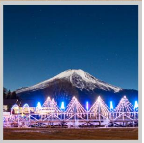
"YAMANAKAKO ILLUMINATION FANTASEUM"