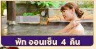
พัก ออนเซ็น 4 คืน