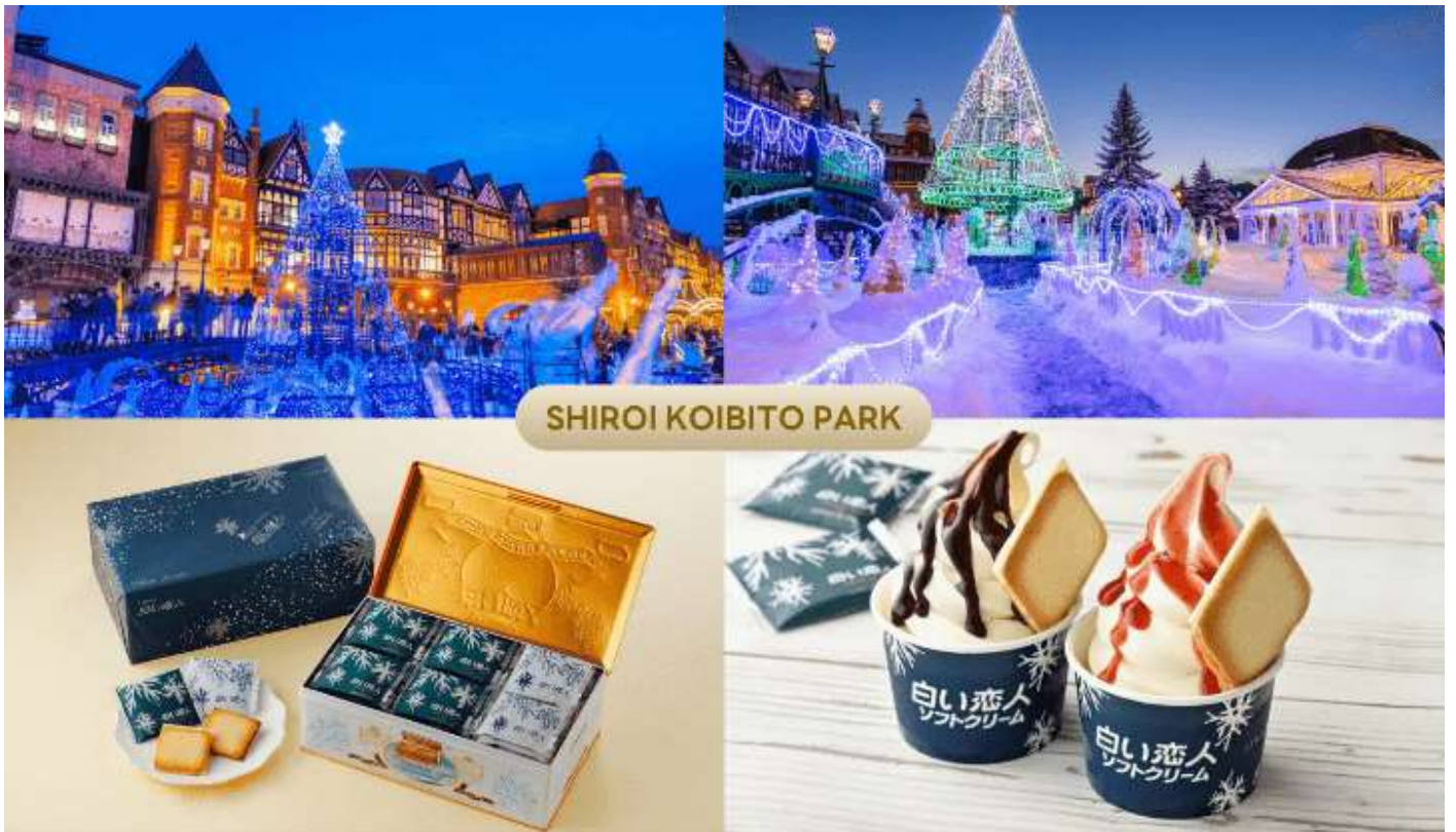
SHIROI KOIBITO PARK

นำท่านสู่ โรงงานช็อกโกแลต ชิโรอิ โคอิบิโตะ (Shiroi Koibito Park) ช็อกโกแลตชั้นชื่อของเกาะฮอกไกโดภายในบริเวณที่แห่งนี้ ประกอบด้วย ร้านค้า ร้านกาแฟ ร้านอาหาร และพิพิธภัณฑ์โรงงานช็อกโกแลตพร้อมจำหน่ายช็อกโกแลตหลากหลายรูปแบบ เป็นอีกหนึ่งสถานที่ที่สวยงามด้วยตัวตึกเป็นอาคารสไตล์ยุโรป จึงทำให้บรรยากาศนั้นเหมือนหลุดไปเดินอยู่ในเมืองโรมานติกของยุโรปเลยทีเดียว