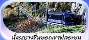
นั้งรถรางขึ้นยอดเขาฟลอม

เปิดประสบการณ์สุดว้าว... สักครั้งในชีวิต! ล่องเรือชมฟยอร์ด นั่งรถไฟสายโรแมนติกฟลอมสพาน่า เบอร์กิน ชมเมืองเก่าบรีกเกน นั่งรถรางขึ้นยอดเขาฟลอมชมวิวเมือง ไมควรพลาตั่ง Cable car ขึ้นยอดเขาอูลริเคน ชม Top view ตระการตา ความอลังการระดับมาสเตอร์พีซ จุดชมวิวดัสตาสไนด์ เดินเล่นตลาดปลาเบอร์กิน ขึ้นชมโบสถ์ออสโลเยี่ยมชมโอเปร่าเฮาส์ มหาวิหารออสโล ป้อมปราการอาครส์ฮุส รัฐสภาแห่งนอร์เวย์ สวนอนุชชาติ Vigeland Sculpture Park ซ็อบปิงถนน Karl Johans gate