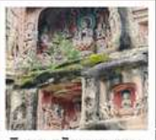
หินแกะสลักหนานคาน

PERIOD 1 : 13 - 17 ต.ค. 2569 PERIOD 2 : 17 - 21 ต.ค. 2569