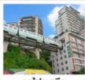
รถไฟกะลุดึก

ภูเขาควงอู๋ซาน (รวมกระเช้า) • อุทยานหมีเขาสาน หินแกะสลักหนานคาน • ชมรถไฟกะลุดึก หงหยาดัง • ถนนคนเดินเจี๋ยฟางเป่ย์