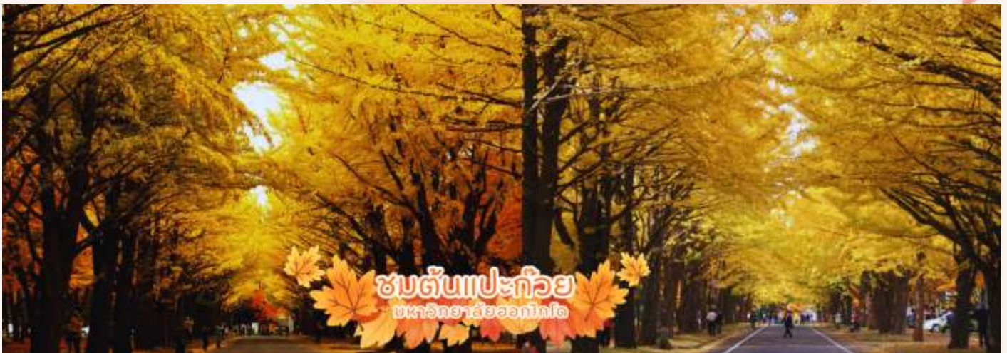
ชมต้นแปะก๊วย มหาวิทยาลัยฮอกไกโด

จากนั้นนำท่านไป ชมต้นแปะก๊วย (Ginkgo) ที่สวยที่สุดในซัปโปโร ที่ มหาวิทยาลัยฮอกไกโด (Hokkaido University) โดยมี "อุโมงค์แปะก๊วย" (Ginkgo Avenue) ความยาวกว่า 380 เมตร ซึ่งจะเปลี่ยนเป็นสีเหลืองทองอร่ามในช่วงฤดูใบไม้เปลี่ยนสี (ปลายเดือนตุลาคม – ต้นเดือนพฤศจิกายน) (การเปลี่ยนสีของใบไม้ในฤดูใบไม้ร่วง ขึ้นอยู่กับสภาพอากาศ)