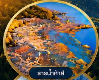
ธารน้ำห้ำสี่