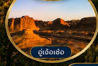
อู่เจ้อเซ่อ