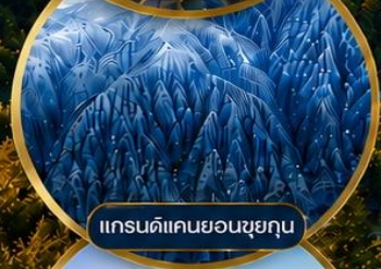
แกรนด์แคนยอนซุยกุน