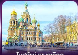
โบสถ์แห่งหยดเลือด