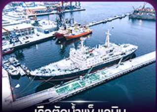
เรือตัดน้ำแข็งเลนิน