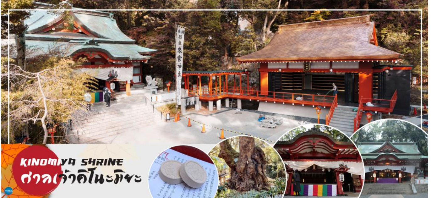
KINOMIYA SHRINE ศาลเจ้าคิโนะมิยะ

เพราะที่นี่ถือเป็นสิ่งสถิตของเทพเจ้าทั้งหลาย ซึ่งในปัจจุบันที่นี้ถือเป็นตัวแทนของศาลเจ้าคิโนะมิยะทั้ง 44 ศาลเจ้าทั่วประเทศ เป็นศูนย์รวมของความเคารพบูชา นอกจากนี้ยังมีอนุสาวรีย์ธรรมชาติแห่งชาติ และยังมีต้นไม้ยักษ์ขนาดเส้นผ่านศูนย์กลาง 24 เมตร ตั้งอยู่ในเขตวัด ว่ากันว่าหากเดินวนรอบต้นไม้หนึ่งรอบ อายุก็จะยาวขึ้นไปอีกหนึ่งปีแม้ที่นี่จะดูน่าเกรงขามแต่พอเข้าไปกลับรู้สึกอุ่นใจ ผู้ที่มาขอให้ตนสามารถเลิกเหล้า เลิกบุหรี่ให้สำเร็จก็มีมาก และยังมีเครื่องรางความรักสุดน่ารักวางขายอีกด้วย