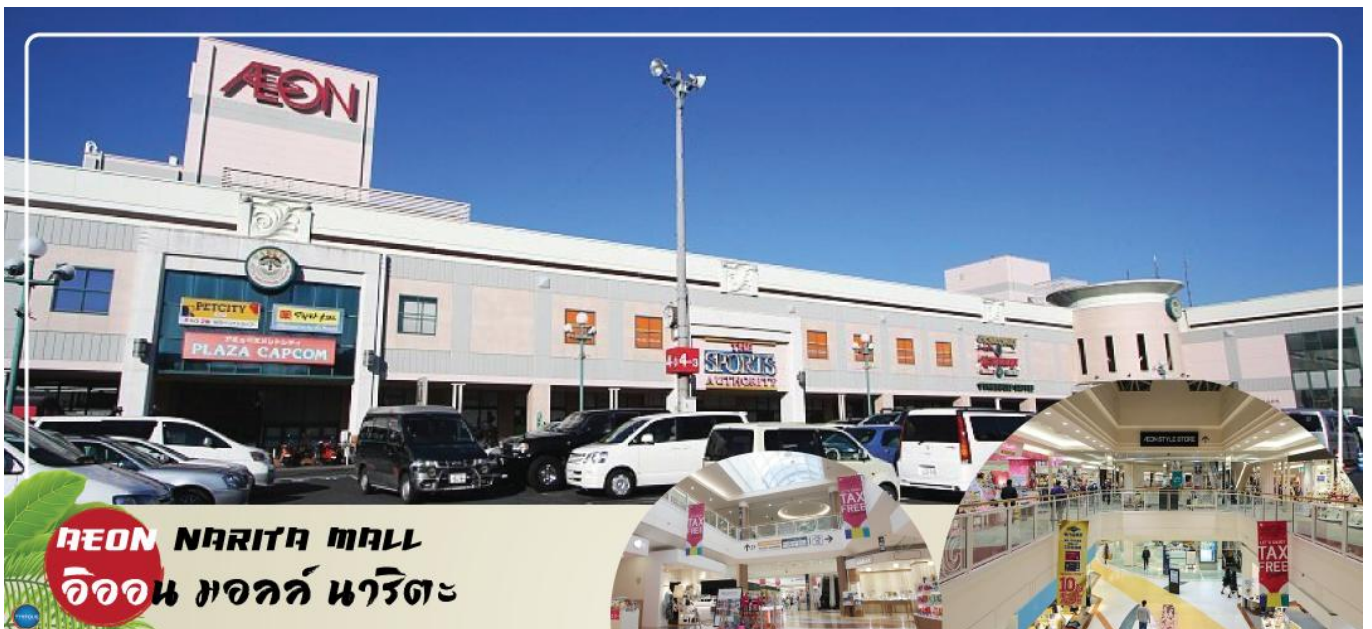
AEON NARITA MALL อโชน มอลล์ นาริตะ

จากนั้นเดินทางสู่ อโชน มอลล์ นาริตะ (Aeon Narita Mall) ห้างสรรพสินค้าที่นิยมในหมู่นักท่องเที่ยวชาวต่างชาติ เนื่องจากตั้งอยู่ใกล้กับสนามบินนานาชาตินาริตะ ภายในตกแต่งในรูปแบบที่ทันสมัยสไตล์ญี่ปุ่น มีร้านค้าที่หลากหลายมากกว่า 150 ร้านจำหน่ายสินค้าแฟชั่น อาหารสดใหม่ และอุปกรณ์ภายในบ้าน นอกจากนี้ยังมีร้านเสื้อผ้าแฟชั่นมากมาย เช่น MUJI, 100 yen shop, Sanrio store, Capcom games arcade และซูเปอร์มาร์เกตขนาดใหญ่