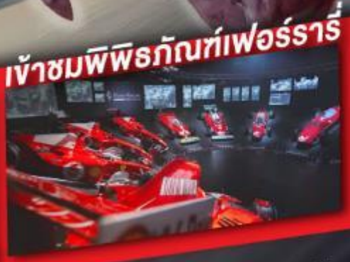
เข้าชมพิพิธภัณฑ์เฟอร์รารี