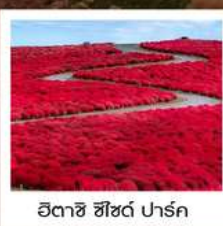
ฮิตาชิ ซีไซด์ พาร์ค