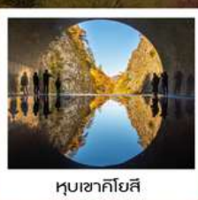
หุบเขาคิโยสึ

ฮิตาชิ ซีไซด์ พาร์ค / น้ำตกฟูคูโระดะ / สวนเก็บผลไม้ / หมู่บ้านโบราณโออุจิจูกุ ปราสาทสิรุกะ (ถ่ายภาพด้านนอก) / ทะเลสาบโทชิคินุมะ / ศาลเจ้ายาฮิโกะ สวนยาฮิโกะ / ตลาดปลาทะเลโอดามาริ / หุบเขาคิโยสึ / คาวาบะ เดินเอ็น พลาซ่า นั่งกระเช้าลอยฟ้านาเอบะ ดรากอนโดล่า / เมืองคาวาโกเอะ สวนฮิโนะคาชิระ / วัดจินโดจิ / ซุปบึงชินจูกุ