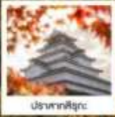
ปราสาทนิงงะ