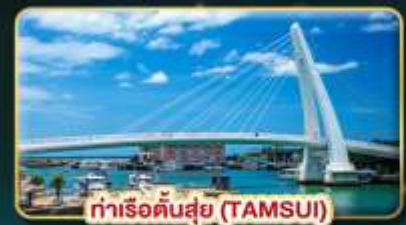
ท่าเรือตันซู่ (TAMSUI)