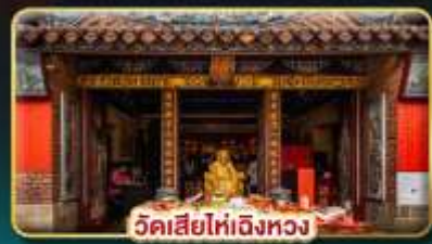
วัดเสี่ยไท่เจี๋ยหวง