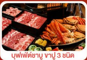
บุฟเฟ่ต์ชาบู ฆ่าปู 3 ชนิด