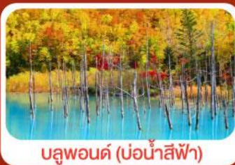
บลูพอนด์ (บ่อน้ำสีฟ้า)