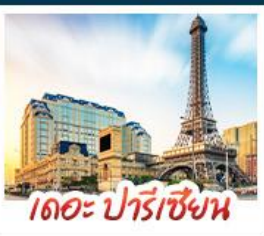
เดอะ ปารีสเซียน

สัมผัสบรรยากาศ เดอะ เวเนเซียน มาทากู เสมือนได้ช้อปปิ้งลาสเวกัส ชมความวิจิตรตระการตาของพระราชวังหยวนหมิงหยวนใหม่แห่งจุไห่ เช็กอินกับแลนด์มาร์กสุดฮิตจตุรัสฮวาเล็งถ่ายรูปลับหอทิพย์ของกวางเจา เที่ยวชมหมู่บ้านสไตล์ยุโรปแห่งใหม่ของเซนจิน • ช้อปปิ้งเพลิน ๆ ที่ห้างสรรพสินค้า COCO PARK ถนนคนเดินฟู้หัวหลี่และถนนคนเดินบิกทิง