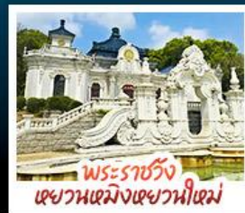
พระราชวัง แชวหนเมิ่งแฉวหนี่เซม