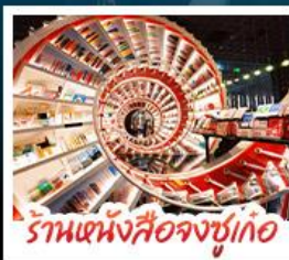
ร้านหนังสือจุงซูเกอ