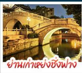
ย่านเก่าแห่งซิงฟาง