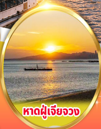
หาดผู้เจียววง