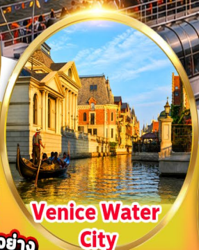
Venice Water City