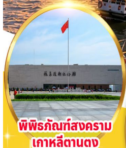
พิพิธภัณฑ์สงคราม เกาหลีตานตง