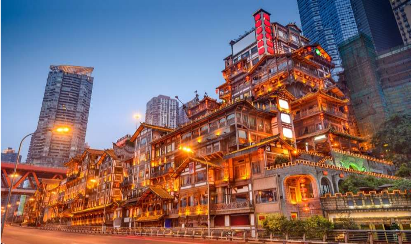
ที่พัก HOLIDAY INN & Suites Chongqing Nanan หรือเทียบเท่าระดับ 4 ดาว

ซึ่งกลายเป็นแลนด์มาร์กสำคัญของเมือง ภายในมีร้านค้า ร้านอาหาร โรงแรม ร้านขายสินค้าที่ระลึก ฯลฯ (โดยเฉพาะ ชั้น 4 ที่เป็นตลาดอาหาร) ที่นี่ยามค่ำคืนถือเป็นจุดนัดพบพักผ่อนของชาวเมือง และจุดชมวิวชั้นดี ชั้นบนสุดของอาคารมีจุดชมวิวที่สามารถมองเห็นทิวทัศน์ของแม่น้ำเจียงหลิงและเมืองฉงชิ่งได้อย่างสวยงาม ยามค่ำคืนจะเต็มไปด้วยแสงไฟสีทองนวลที่ส่องสว่าง ทำให้ที่นี่มีบรรยากาศที่งดงามและโรแมนติกจนหลายคนเปรียบเทียบกับฉากในภาพยนตร์แอนิเมชัน Spirited Away อีกทั้งยังเป็นจุดถ่ายรูปที่สำคัญของนักท่องเที่ยวอีกด้วย