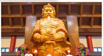
วัดเขกทมิว