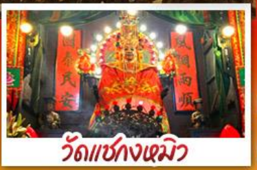
วัดเชกวงเมียว