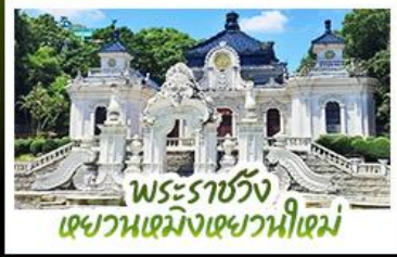
พระราชวัง เฉวียนเหมิงเฉวานี่เหม่