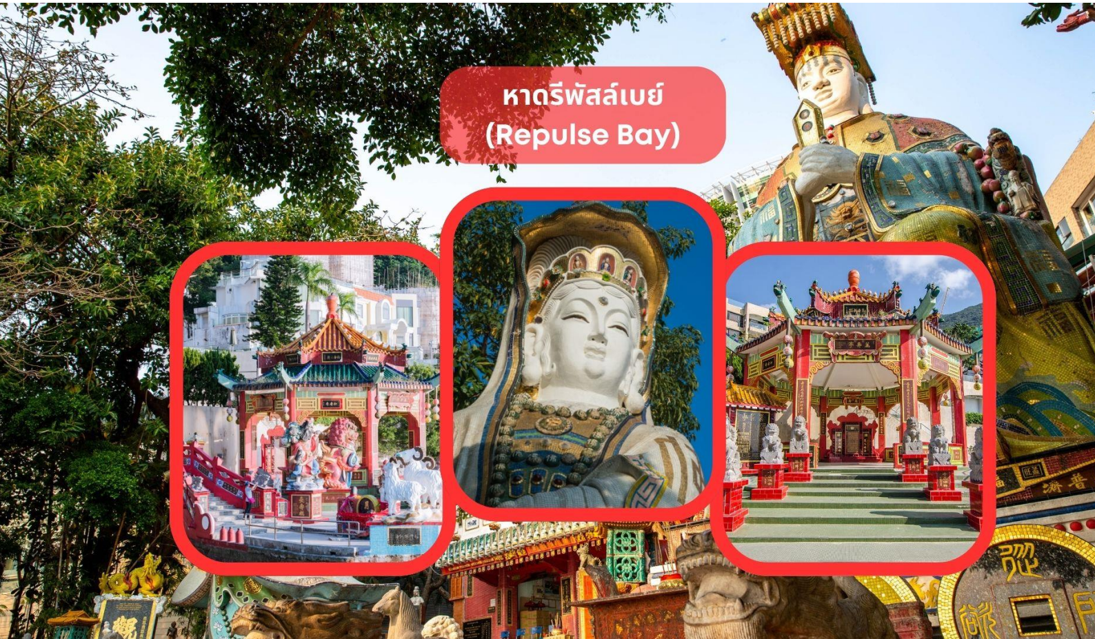
หาดรีพัลส์เบย์ (Repulse Bay)

อิสระอาหารค่ำ เพื่อความสะดวกในการช้อปปิ้ง