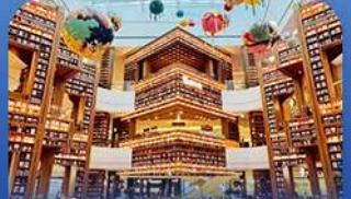
ห้องสมุดคSTARฟีด