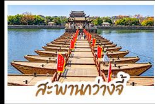
สะพานกว้างจี้