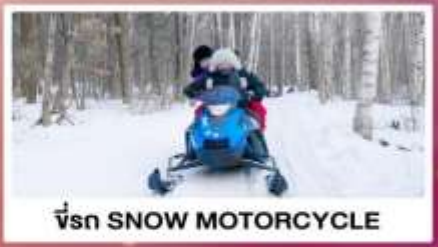
ขี่รถ SNOW MOTORCYCLE