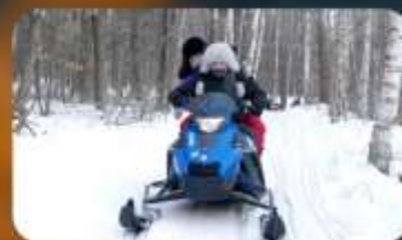
จักรยาน SNOW MOTORCYCLE