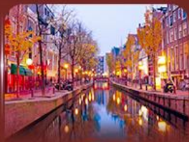
ย่าน Red Light อัมสเตอร์ดัม