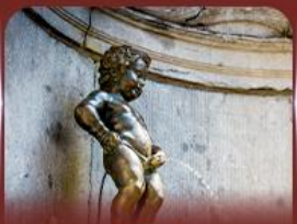
manneken pis บรัสเซลส์