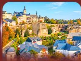
ย่านเมืองเก่า ลักเซมเบิร์ก