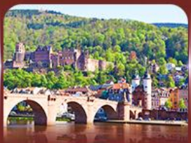
ชมเมืองสวย ไฮเดลเบิร์ก