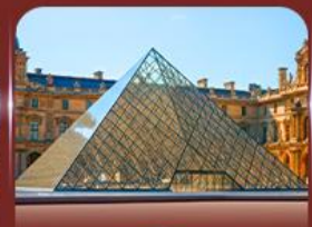
เข็ควินพิพิธภัณฑสถานลูฟวร์ ปารีส