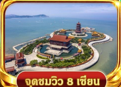
จุดชมวิวกว 8 เซียน

เทศกาลเบียร์ชิงเต่า QINGDAO INTERNATIONAL BEER FESTIVAL