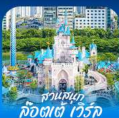
สวนสนุก ล็อดเจตัส วัลวิค