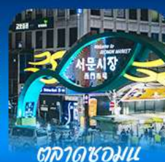
ตลาดชอมนุน