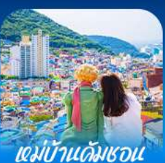
หมู่บ้านคิมชอน