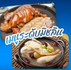
เมนูระดับมิชลิน

เดินทาง 02 - 07 ก.ย. 69 20 - 25 ส.ค. 69 | 17 - 22 ก.ย. 69