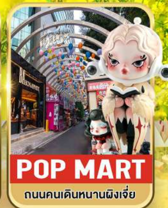
POP MART ถนนคนเดินหนานผิงเจี๋ย