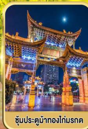
ซุ้มประตูม้าทองไถ่มรดก