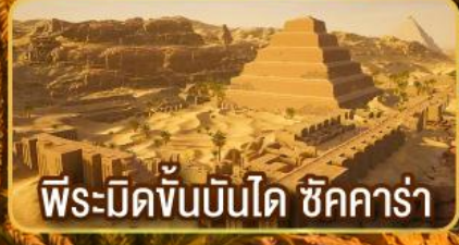
พีระมิดขั้นบันได ชิคคาร์่า