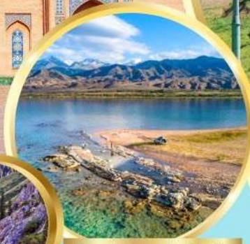
ล่องเรือทะเลสาบอิสซิค